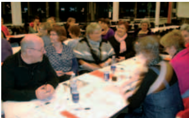
32 medlemmer deltog i generalforsamlingen i Pædagogisk sektor

Der var 32 stemmeberettigede til generalforsamlingen i Pædagogisk sektor, som blev afholdt mandag den 21. februar 2011 på UC Syddanmark.