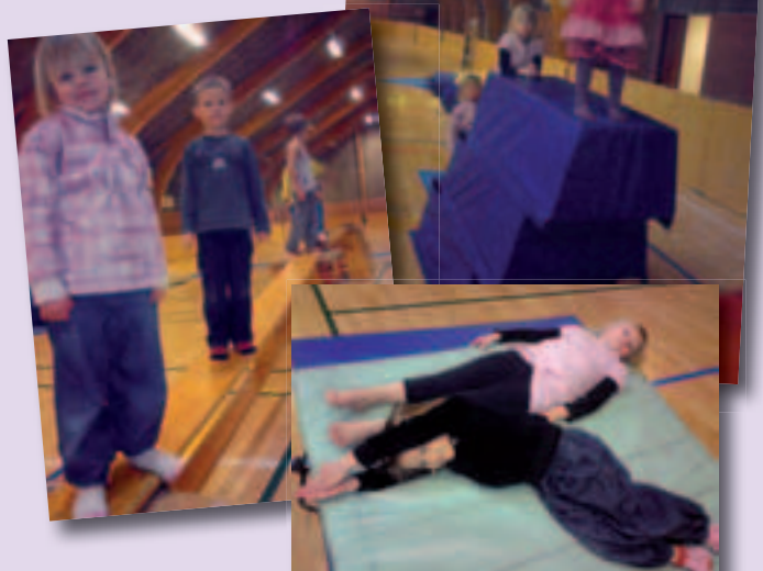
Børn fra Gesten Børnehave