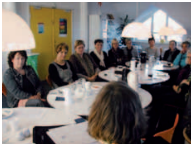
13 medlemmer deltog i opstartsmødet.

Møderne bliver skiftevis holdt i FOA Esbjerg og FOA Varde.